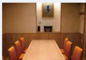
テーブル個室 4～12名様まで