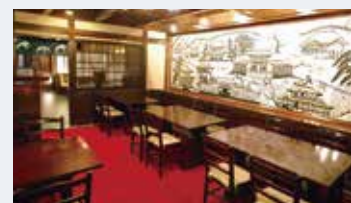
テーブル席「東山」 1～36名様まで

※個室料として別途、ご飲食代金合計の5%頂いております。 ※個室の使用時間は2時間です。 ※土日祝日の個室利用は懐石6600円(税サ込)からのご利用をお願いします。