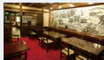
テーブル席「東山」 1～40名様まで

※個室料として別途、ご飲食代金合計の5%頂いております。 ※個室の使用時間は2時間です。